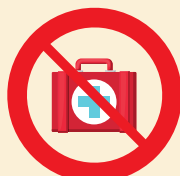
GESSO E SUTURAS